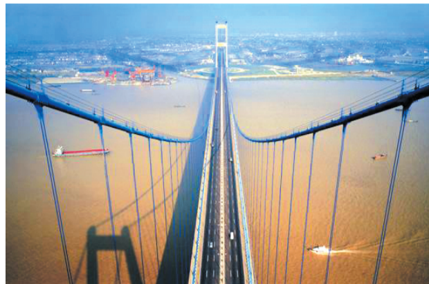
曾经的锁航要塞，如今江阴大桥贯通南北