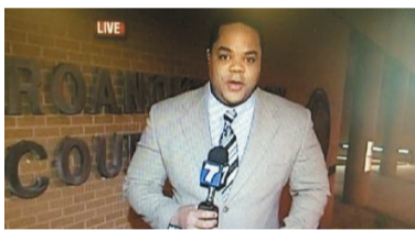
媒体公布的枪手照片