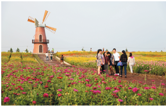
牛角大圩人气爆棚

据了解,今年将举办2015合肥包公园第八届包公文化节暨首届菊花展,邀你赏金秋菊花的独特魅力。 在赏花之余,你还可以拍下精彩瞬间,参与包公巡游、读书郎、回澜轩饮茶、《包公故事》明信片首发暨作者签售会、刘居时《包公故事》画展等活动。 此外,滨湖新区规划建设五大公园,至今年“十一”前,已