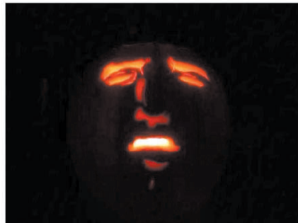
一名网友做的南瓜灯……