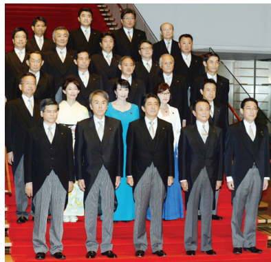
安倍晋三(前排中)与众閣僚合影