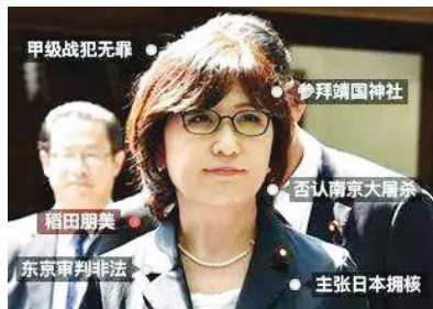
△稻田朋美,日本国会众议院议员,日本女性政治家、律师、税务师,自由民主党党员,2005年至今已连续4次当选众议院议员。(资料图)