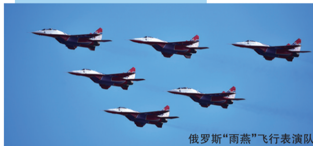
俄罗斯“雨燕”飞行表演队

从“低端起步”到“高端发展”，从“跟踪发展”到“自主创新”——记者从主办方了解到，本届航展的展品结构、展览质量以及航空产业的开放合作都跃上了新高度。■据央视新闻、《京华时报》