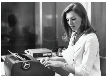
为生活同时打几份工