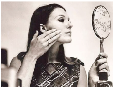
30多岁的她重操旧业当模特临时工