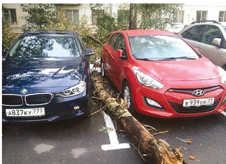
我们俩的运气都不错