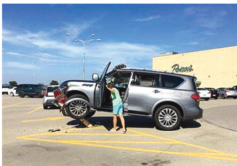
油门当刹车了肯定是!