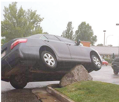
咋上去,你咋下来呢