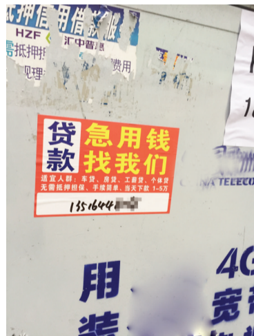
随处可见的校园贷小广告