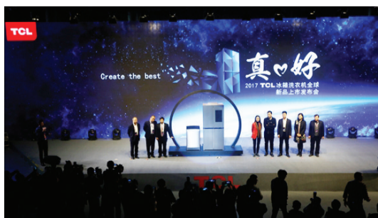
3月7日，上海1933老场坊，“真·好”2017 TCL冰箱洗衣机新品全球上市发布会盛大开启。

全国人大代表、中国中铁股份有限公司总工程师王梦恕表示，高铁票价早晚要涨，具体怎么个涨法，这个不是中国铁路总公司能定下来的。将近20多个铁路局，哪个地方涨，哪个地方不涨，而且涨多少，国家都要研究。 ■ 据《新京报》