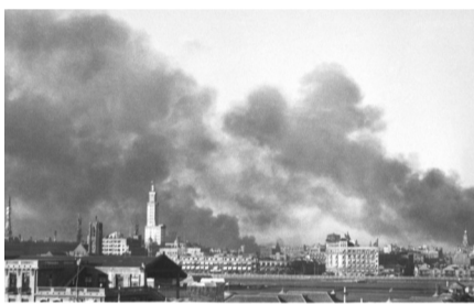
淞沪会战中上海闸北腾起的战火