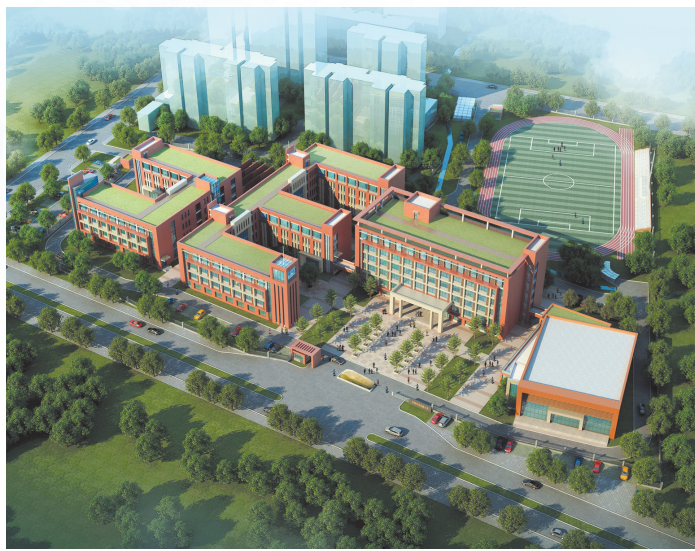
和平东校幸福路分校鸟瞰图