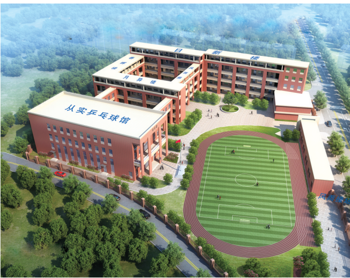
和平东校南陵路校区鸟瞰图