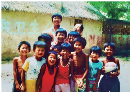
20世纪80年代,严岗小学的孩子们(严岗村后来成为小岗村的一部分)