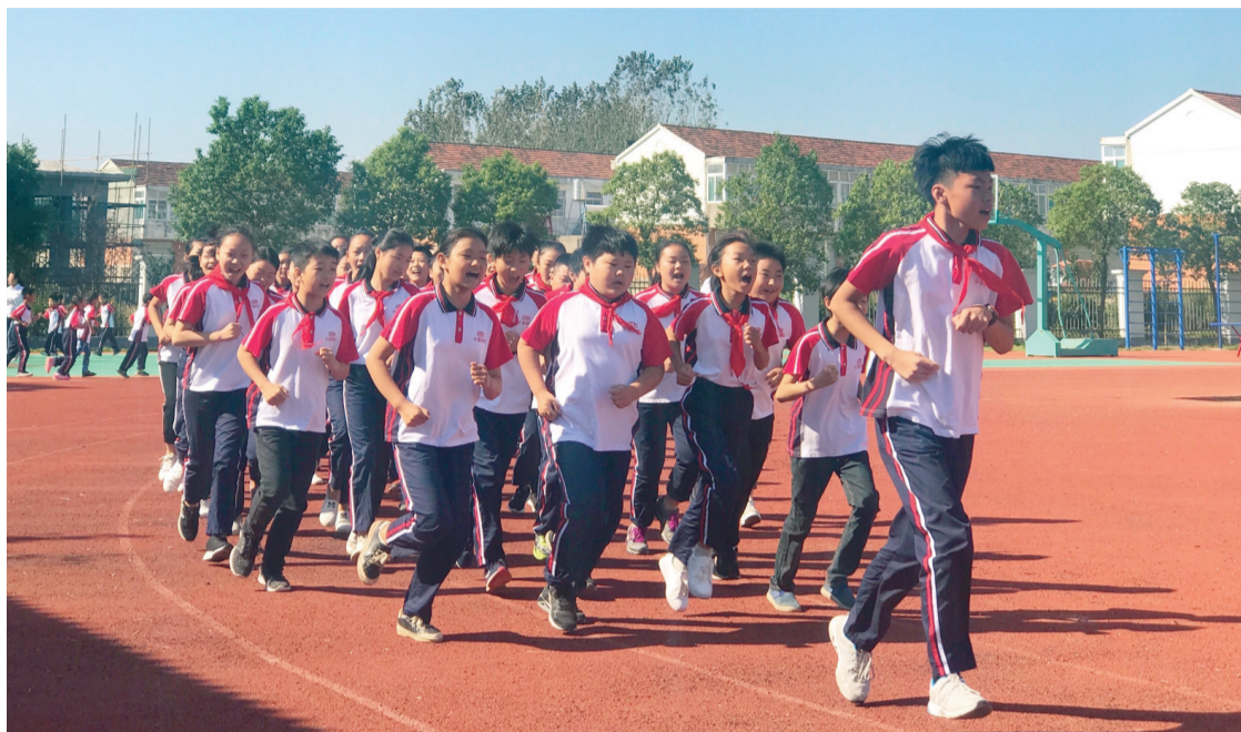
小岗学校的孩子们在操场跑步