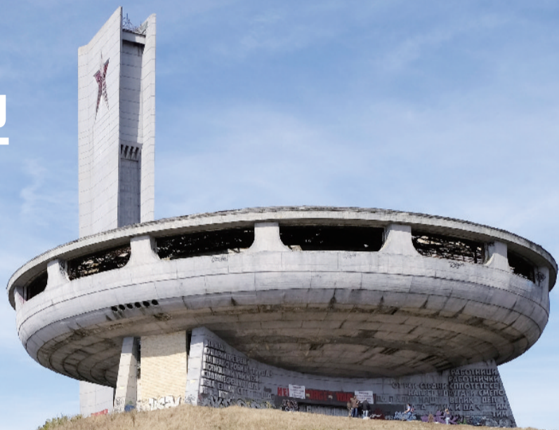
位于布兹卢达山顶的形似飞碟的建筑,是世界上最著名的建筑废墟遗址

保加利亚布兹卢达纪念碑(Buzludzha)也被人们称为“冰峰纪念碑”。这座废弃的建筑位于保加利亚具有历史意义的布兹卢达(土耳其语意为冰川)山顶,在19世纪末迪米特·布拉戈耶夫及其追随者建立保加利亚共产党前身的地方,歌颂着保加利亚爱国者抗击奥斯曼帝国和纳粹德国的斗争。曾经在保加利亚人心中,这片土地被赋予了神圣的色彩。