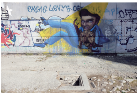
唯一可以进入建筑的入口