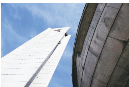
带有红星标志的纪念塔碑高107米