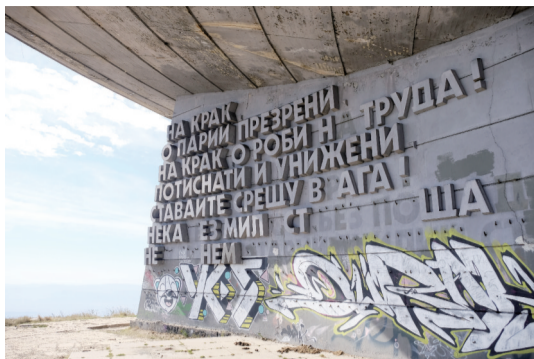
遗址外巨大的文字浮雕取自《国际歌》