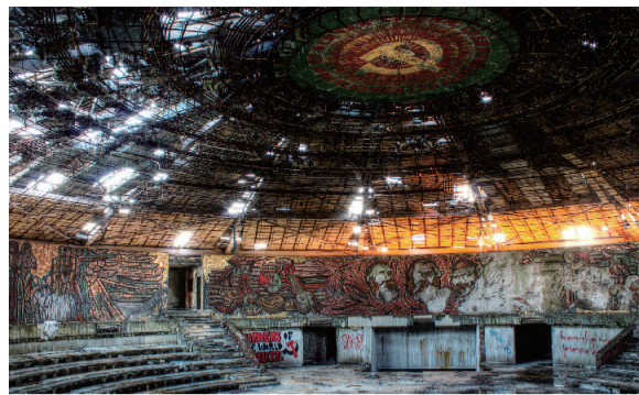
建筑内部令人震撼的景象