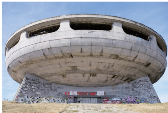
地球上最像飞碟的建筑