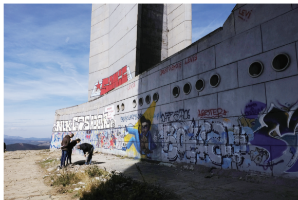
作为一座废墟如今已经完全封闭,只能从一处天花板用绳索进入