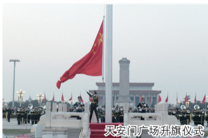
天安门广场升旗仪式