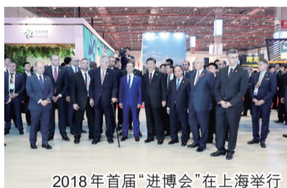
2018年首届“进博会”在上海举行

“一带一路”国际合作高峰论坛是联通世界,进博会则是开放中国。2019年11月,第二届中国国际进口博览会将再度在上海举办。中国国际进口博览局副局长孙成海介绍,第二届进博会举办时间和地点均与首届一致,展览布局和规模继续包括国家综合展、企业商业展和虹桥论坛。此外,第二届进博会总展览面积将超过首届。