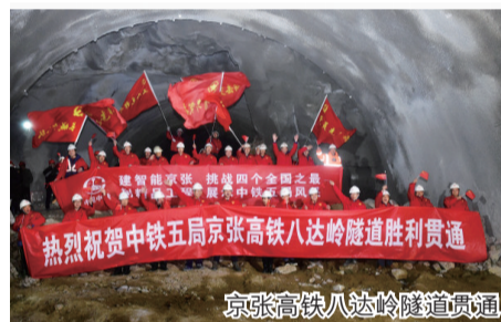
京张高铁八达岭隧道贯通