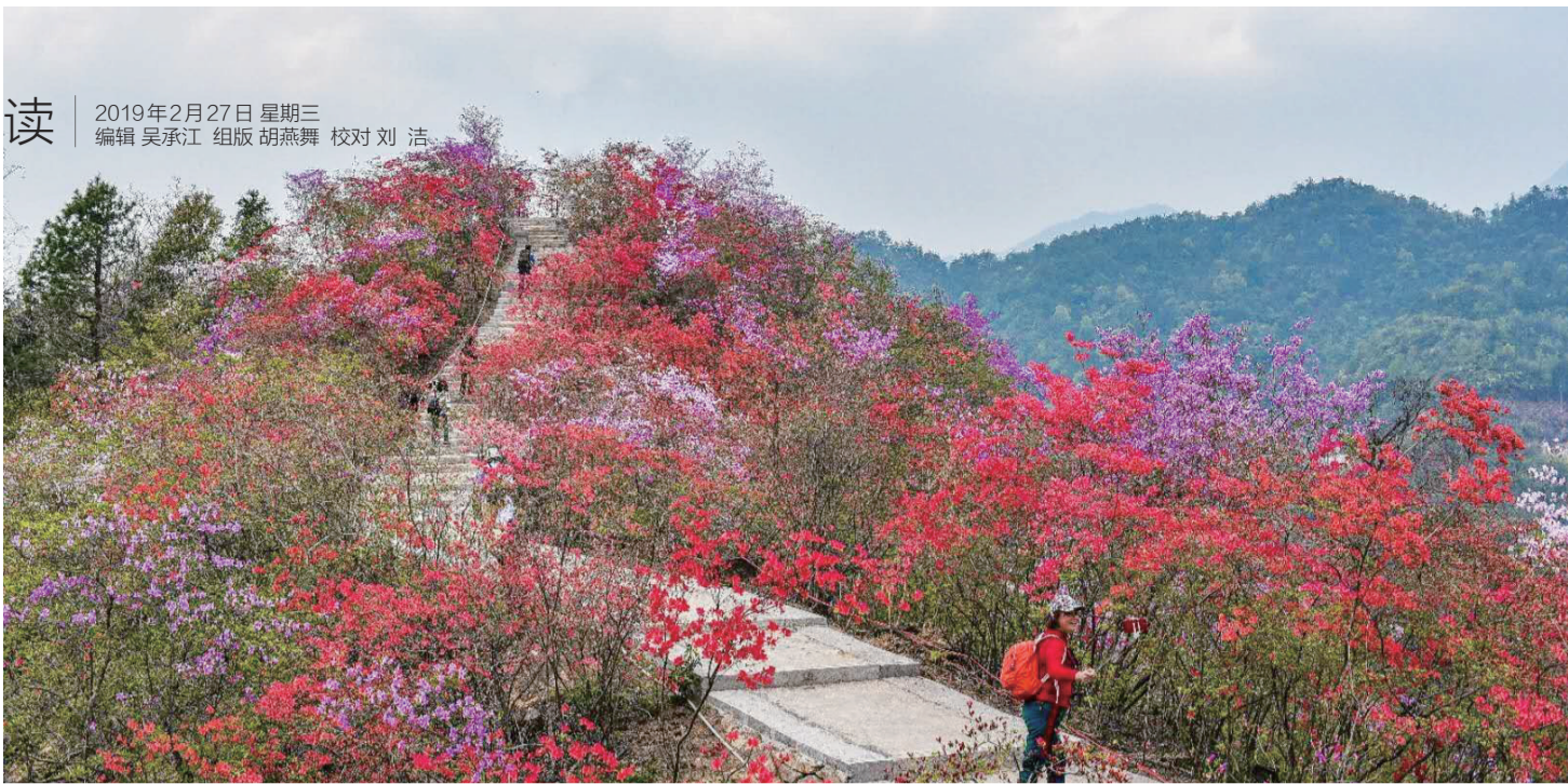
天峡风景区

记者近日走访省城了解到,随着“三八”节的到来,各大旅行社、景区等纷纷推出多条针对女性游客的优惠旅游线路,使早春的旅游市场暖意融融。同时,很多女士也按捺不住出游的激动心情,爬山、赏花的约定不绝于耳。此外,记者通过采访业内专家,直击“她消费”。 □ 记者 张贤良