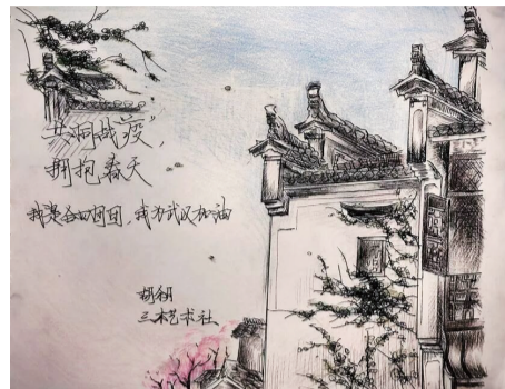
“疫”去春来 合肥四中1920班 胡余月