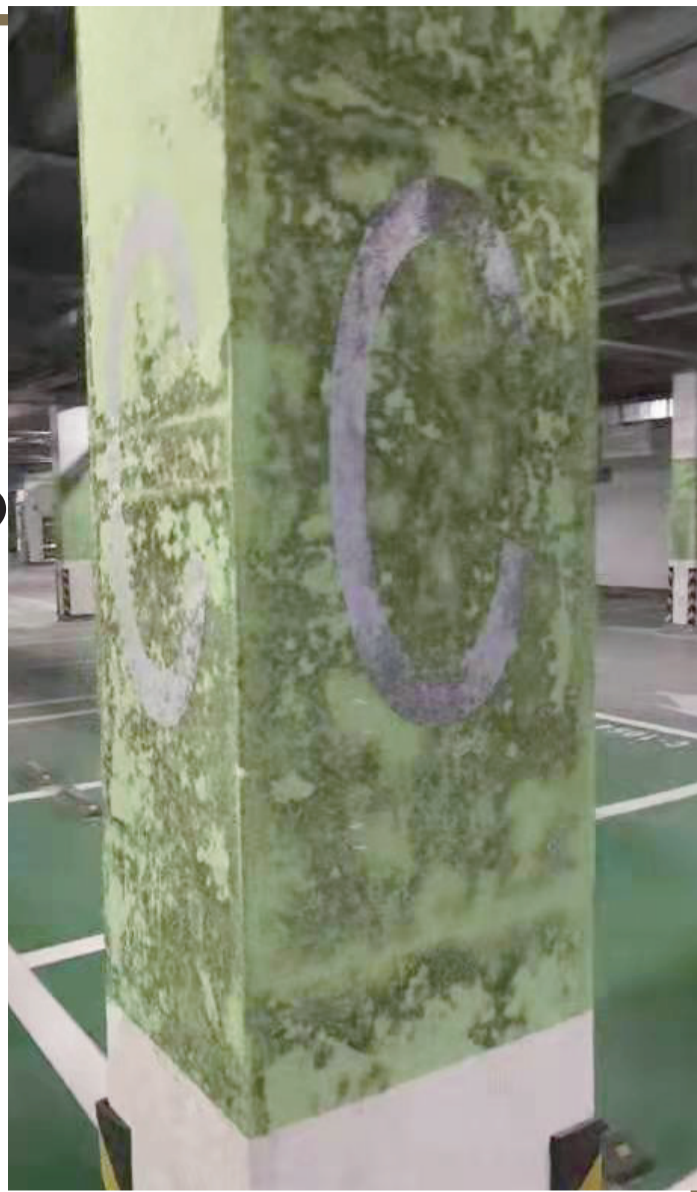
墙柱上的字母因为霉菌变得模糊不清