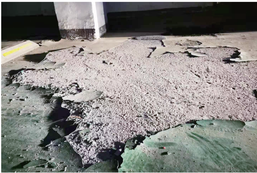
地下车库环氧地坪起皮