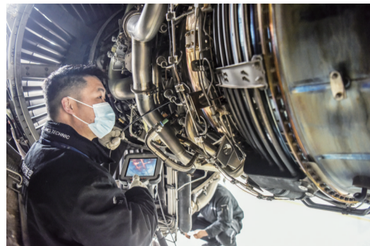
机务人员对飞机发动机进行“孔探”作业，保障飞机动力系统运行安全

2021年春运将从1月28日开始，至3月8日结束，共计40天，这是疫情防控常态化后的首个春运。1月23日，春运前夕，记者分别来到合肥新桥机场和合肥高铁南站，探访备战春运的情况。