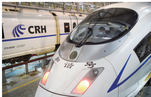
机械师正在进行动车组司机室检查