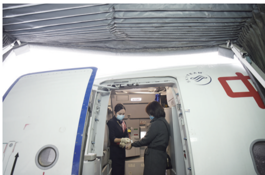
旅客登机前，乘务员用温枪为旅客测温