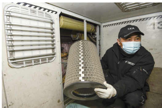
合肥新桥国际机场东航机库，机务人员在检查飞机空调系统再循环风扇气滤