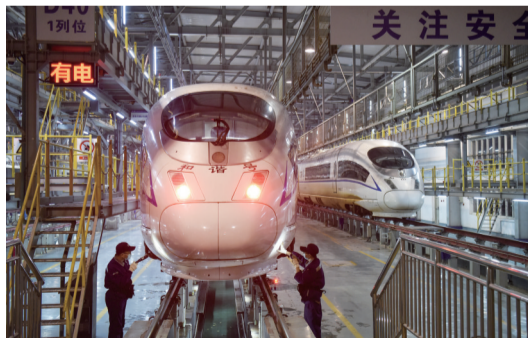
机械师佩戴口罩检查动车组头罩