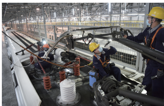
合肥南动车运用所动车组机械师在检测动车组受电弓

1月23日深夜至24日凌晨时分，合肥高铁南站动车运用所内灯火通明，一列列动车组陆续驶入检修库内，进行检修与防疫消杀作业，迎接即将到来的春运。因疫情防控形势需要，今年旅客出行总量、去向分布、出行规律都较往年有不同程度的变化。