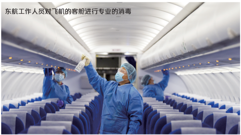
东航工作人员对飞机的客舱进行专业的消毒

东航安徽分公司作为安徽地区唯一一家基地航空公司，针对即将到来的春运，加强了对飞机各系统的重点检查和维护，保证飞机的适航性，提高利用率。同时，根据疫情防控常态化的要求，重点维护飞机客、货舱的空调、空气循环系统，确保运行正常，保障旅客“安心飞”。