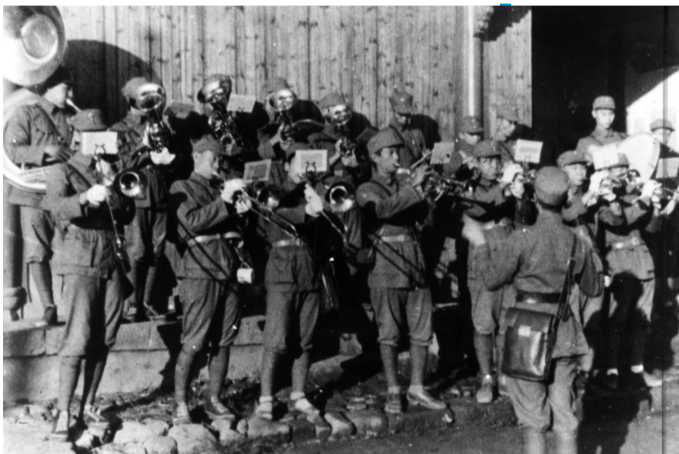
由菲律宾归国华侨组成的新四军军乐队