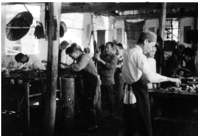
新四军云岭修械所