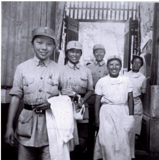
▲朝气蓬勃的新四军卫生训练队女学员