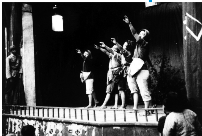
战地服务团为战士表演《插秧舞》