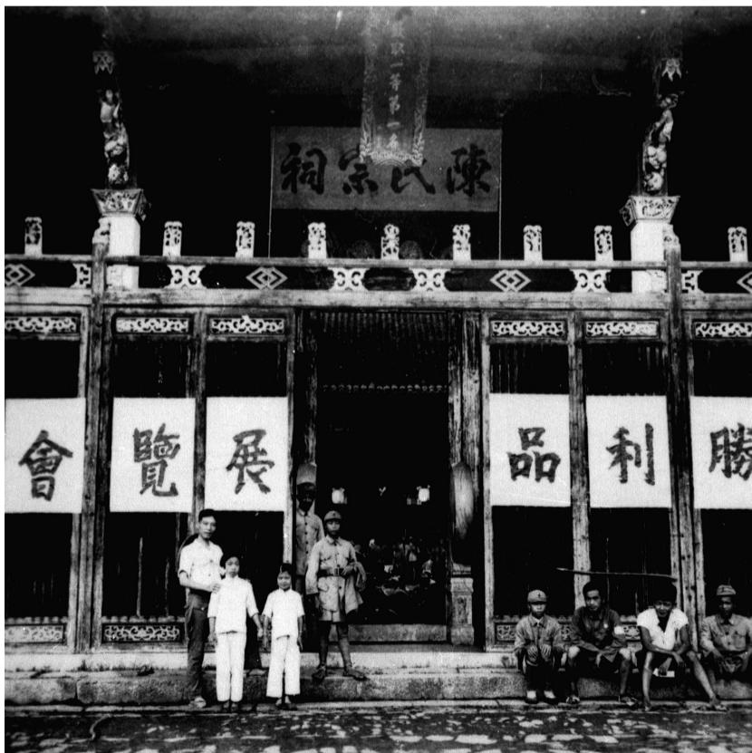
在云岭陈氏宗祠举办的缴获日寇胜利品展览会