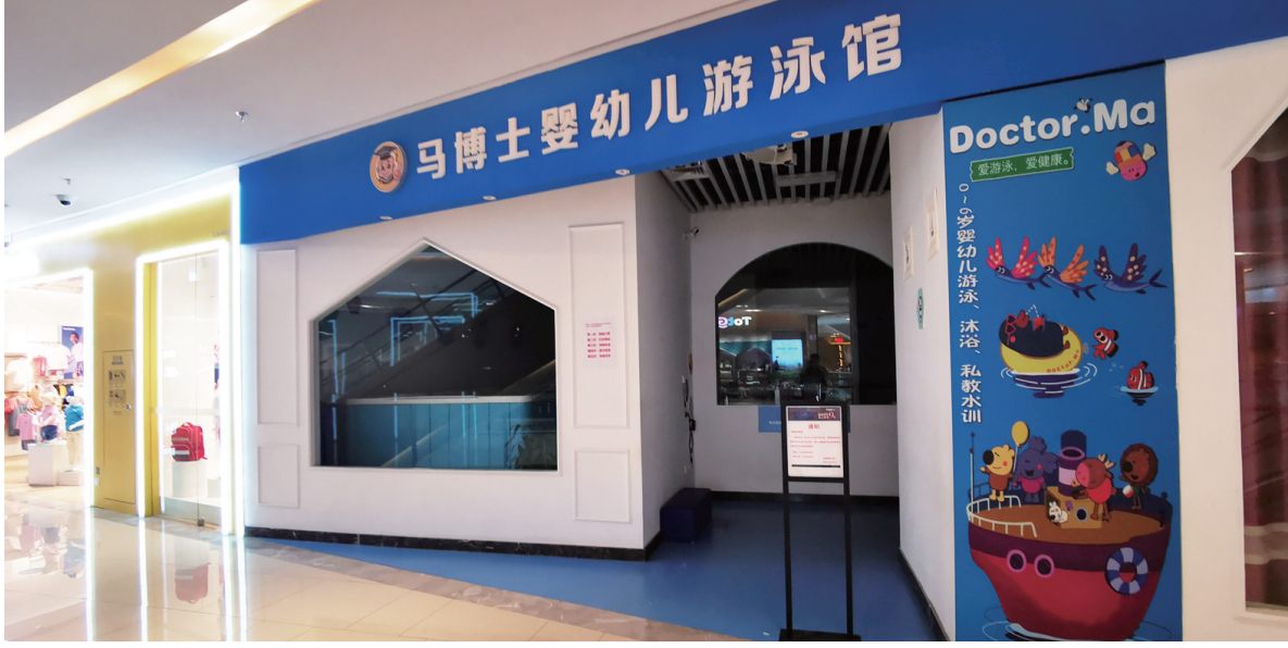
滨湖银泰城马博士已关停