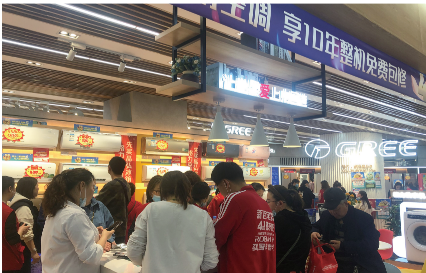
万人空巷抢格力预售现场

本周末,今年的“万人空巷抢格力”活动将在全省格力门店、卖场各大格力展厅正式开抢。劲爆特惠、10年包修、以旧换新、预定即送、多套加赠、幸运抽