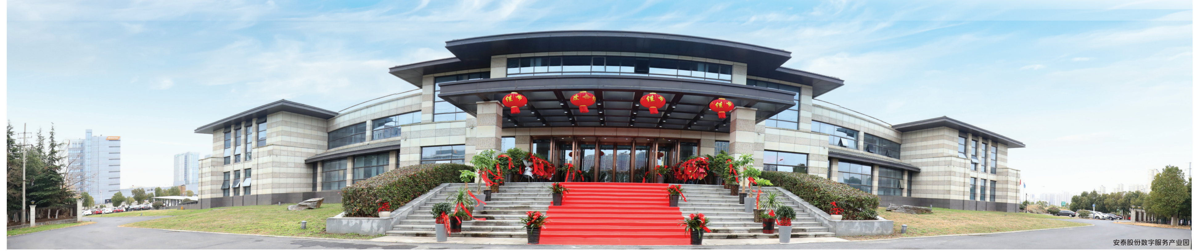
安泰股份数字服务产业园

安泰走过20年风风雨雨很不容易,得益于我们全体安泰人,我们坚持两个理念:第一是我们大道至简,一切为公。所有的工作,一切站在公的角度去考虑,就没有问题、没有矛盾,大家形成合力向前冲;第二是一切以客户为中心,以奋斗者为本,坚持长期艰苦奋斗,坚持批评与自我批评。这两个理念深入我们每一位安泰人的脑子里面,并用实际行动来践行,所以我们走过了20年。往后我们需要安泰人依然披荆斩棘,乘风破浪,迈入下一个20年的发展,我们相信,下一个20年一定会更好。