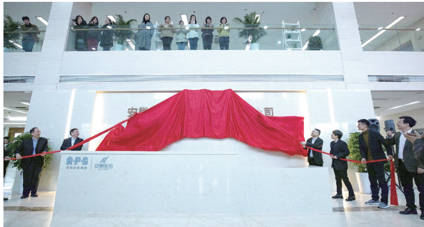
安泰股份入驻安徽出版集团总部基地

近年来,安泰股份全力助推安徽省数字经济发展,为“数字江淮”建设贡献安泰智慧。平台入选工信部制造业“双创”平台试点示范项目、长三角十二大工业互联网平台、首批“皖企登云”推荐云平台等。《2020年合肥市政府工作报告》中提到:“建成安泰科技等一批有影响力的工业互联网平台”;合肥市委常委、常务副市长王文松一行来安泰股份调研了“5G+工业互联网平台”建设情况。据悉,4月28日,由合肥市经信局组织化工、建材、新材料等行业企业,赴安泰股份开展工业互联网沙龙活动,帮助企业数字化、网络化、智能化转型,实现提质增效可持续发展。