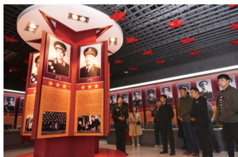
金寨县革命博物馆

大别山是红军的故乡、将军的摇篮，作为我国重要的红色革命圣地，大别山地区有着丰富的红色革命资源，2021年4月到10月六安、安庆两市携手推出2021“美好安徽·红色大别山之旅”宣传推广活动。