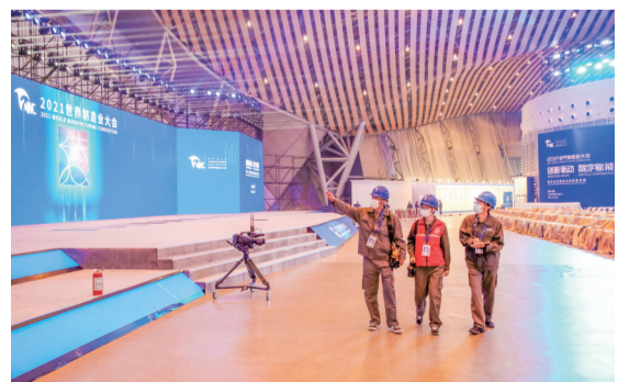
合肥供电公司工作人员在滨湖国际会展中心调试电源设备

11月19日至22日的制造业大会举办期间，合肥电网将全面进入“特级保电时段”，市区主网将保持全接线、全保护方式运行，供电服务指挥平台24小时运作。185位保电工作人员、28部应急车辆将全程驻守于各大保电场所、重要变电站和线路，全程利用无人机、巡检机器人